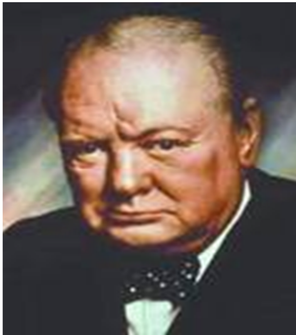
M. Winston Churchill