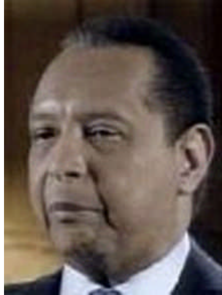
L'ex dictateur Jean-Claude Duvalier, que ERégis Debray voulait réinstaller au pouvoir en Haïti.

d'un écrivain haïtien vivant à Paris et qui m'avait oublié, par mégarde, dans son listing. Ce nouveau Camille Desmoulins exhortait les intellectuels haïtiens à descendre dans la rue le jour même pour renverser le « tyran sanguinaire ».