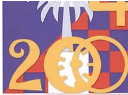
Logo du bicentenaire d'Haïti.

de l'Etat d'Haïti ne soit pas commémoré, le 1er janvier 2004. Il fallait à tout prix séparer Haïti des Africains, de peur que la petite république caraïbe ne devienne un jour l'axe de la renaissance africaine. Régis Debray, Dominique de Villepin et Édouard Glissant, profitant de son grand âge, étaient allés