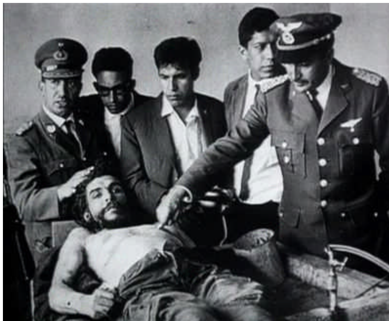
Les militaire boliviens exposent la dépouille mortelle d'Ernesto Che Guevara.